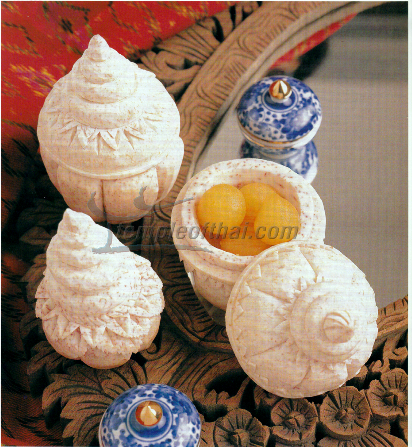
พอบคู่ขวัญ วิธีทำหน้า 48

A Couple of Casket For method, see p. 48